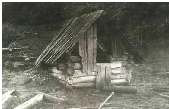
Фото 7. Источник с целебной водой и грязью. С. Ассы, 1975 г.

В фототеке ИИЯЛ УНЦ РАН хранится фотография колодца с лечебной водой и грязью, находившегося в селе Ассы. Фотография датируется 1975 г., сделана в ходе полевого выезда сотрудником сектора этнографии М.Г. Муллагуловым (фото 7).