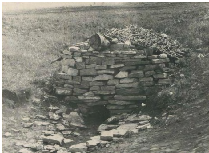
Фото 2. Родник у деревни Ильчигулово Миякинского района БАССР. 1963 г.

из колодца, находящегося внутри. Сам источник расположен в открытой местности, рядом в кадре не видно никаких сооружений, деревьев, домов и пр.