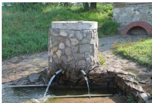
Фото 4. Родник у деревни Ильчигулово Миякинского района Республики Башкортостан. 2017 г.

щий сруб над источником, купальню, мечеть, а также металлическое сооружение в форме шатра на вершине горы над самым захоронением святых (фото 3–6).