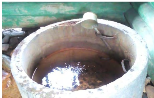
Фото 9. Бетонный колодец внутри сруба

Как было отмечено выше, местные жители с давних пор использовали эту минеральную воду источника при желудочно-кишечных заболеваниях. Кроме того, ее применяли в виде ванн при заболеваниях опорно-двигательного аппарата. По сравнению с ильгигуловским родником ассинский источник в прошлом веке был обустроен более основательно, над ним имелся