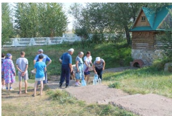
Фото 3. Родник у деревни Ильчигулово Миякинского района Республики Башкортостан. Общий вид. 2017 г.

В настоящее время это место изменилось до неузнаваемости. О причинах этого речь пойдет ниже. Сейчас здесь расположен целый комплекс, включаю-