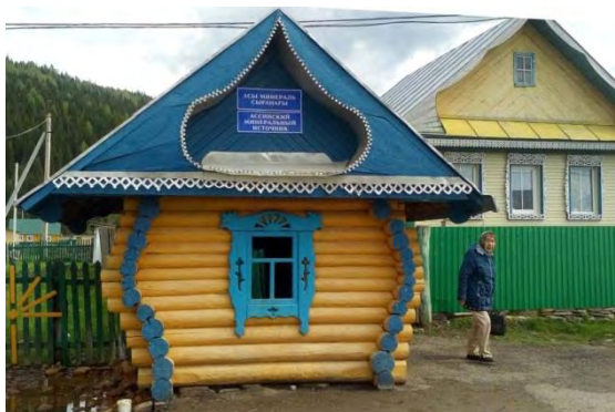
Фото 8. Ассинский минеральный источник. С. Ассы, 2016 г.

Как было отмечено выше, местные жители с давних пор использовали эту минеральную воду источника при желудочно-кишечных заболеваниях. Кроме того, ее применяли в виде ванн при заболеваниях опорно-двигательного аппарата. По сравнению с ильгигуловским родником ассинский источник в прошлом веке был обустроен более основательно, над ним имелся