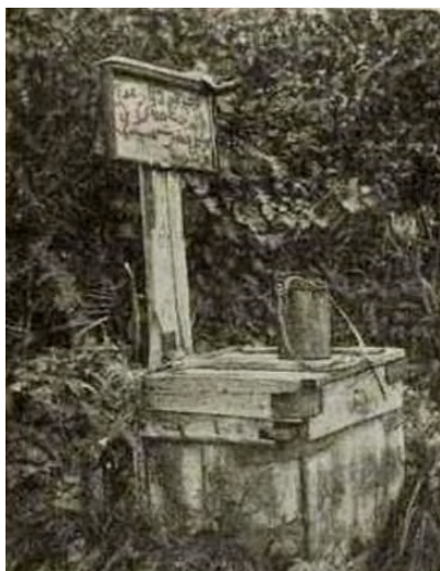
Фото 1. «Священный колодец Сынтар» [3. С. 84]

большого отверстия выходит вода. Судя по изображению, она сверху закрывалась плетнем, который можно было убрать; видимо, для того, чтобы набирать воду