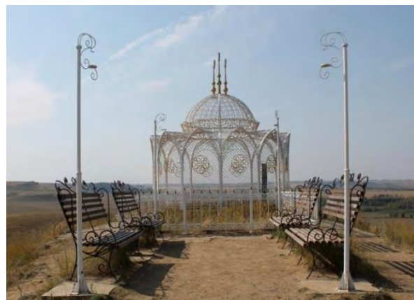
Фото 6. Шатер с надгробием над могилой святых на горе Нарыстау. 2017 г.

паломники из Казахстана и Средней Азии [4. С. 138]. Здесь, на площадке высокого сырта, расположен целый средневековый некрополь Ильчигулово–IV, куда